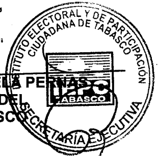
DR. FERNANDO VALENZUELA PERRAS FISCAL GENERAL DEL ESTADO DE TABASCO